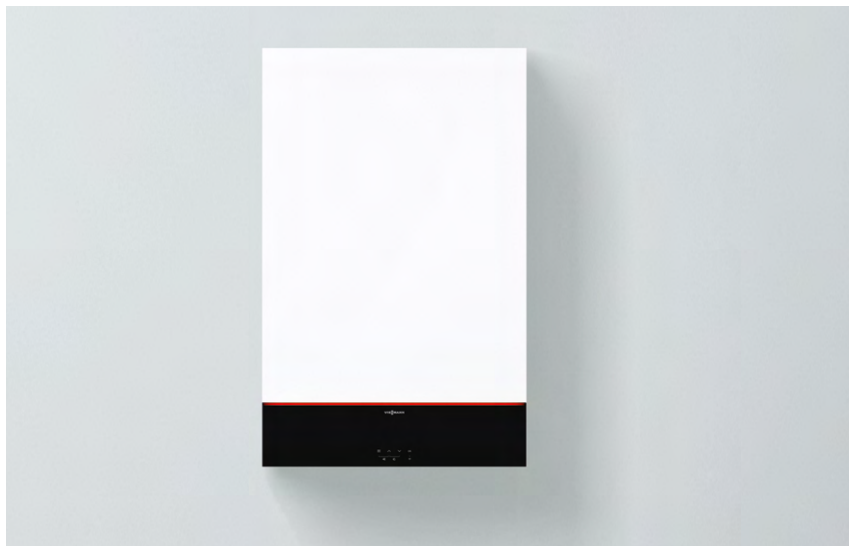
Vitodens 100-W nuovo design e colore Vitopearlwhite

Vitodens 100-W è una caldaia murale a condensazione a gas con un rapporto qualità/prezzo molto interessante. Grazie alla accessibilità frontale di tutti i componenti interni, al peso ridotto e alla silenziosità, si integra facilmente in qualsiasi appartamento e abitazione mono- o bifamiliare. La caldaia è dotata di display LED a 7 segmenti e 4 tasti touch con pannello nero frontale su tutta la larghezza di caldaia. È possibile la gestione di un circuito diretto e/o un circuito miscelato.