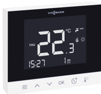
Nuovo Vitotrol 100-E