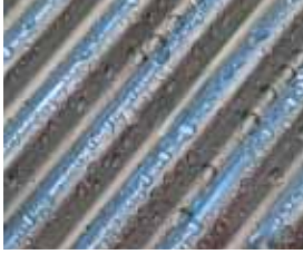
Scambiatore di calore Inox-Crossal in acciaio inossidabile