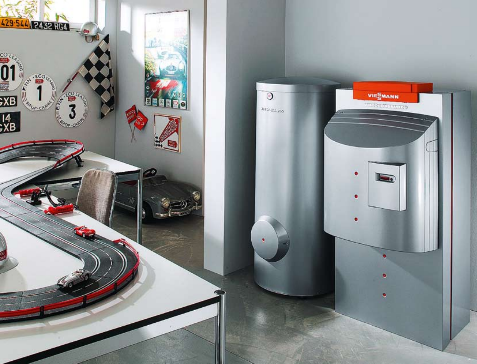
Vitocrossal 300 in abbinamento al bollitore Vitocell 300-V