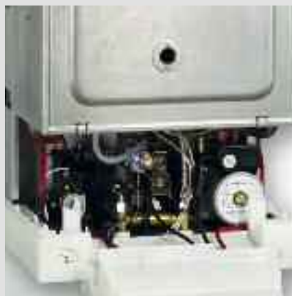
Manutenzione agevolata: tutti i componenti sono comodamente accessibili dal lato frontale

Vitopend 100-W offre la massima semplicità di utilizzo ed un elevato comfort nella produzione di acqua calda sanitaria, sempre immediatamente disponibile e a temperatura costante grazie allo scambiatore di calore a piastre in acciaio inox integrato nella caldaia.