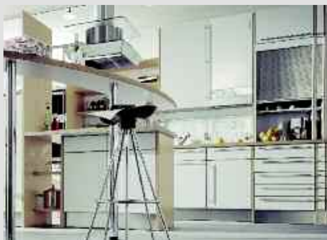
Facile integrazione nei locali abitativi: Vitopend 100-W, modello WH1B