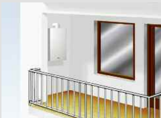
Vitopend 100-E installata su balcone