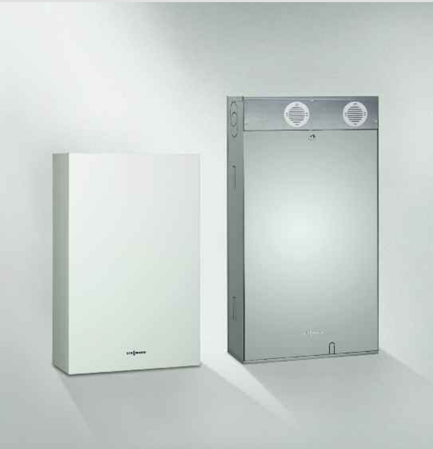
Vitopend 100 - E versione per esterno e da incasso