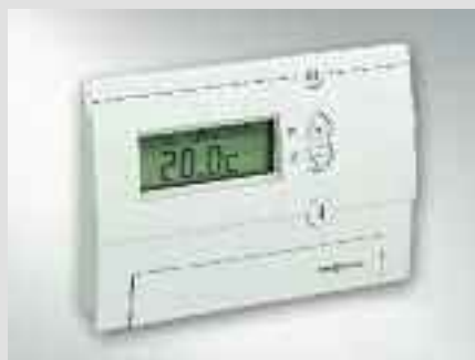
Vitotrol 100 - Comoda gestione della caldaia dai locali di abitazione tramite comando remoto

Vitopend 100-E è una caldaia ad alto rendimento che ha ottenuto la classificazione ★★★ secondo la Direttiva rendimenti 92/42 CEE. Ciò deriva dall'ottimale sfruttamento della combustione, che consente di ridurre notevolmente il consumo di gas.