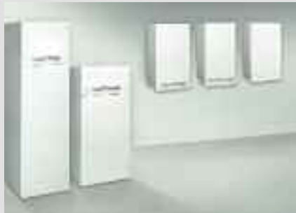
Caldaie murali a gas di tipo convenzionale o a condensazione

Tutti i prodotti sono perfettamente compatibili e integrabili tra loro e offrono pertanto il massimo dell'efficienza, dalla progettazione alla messa in funzione.