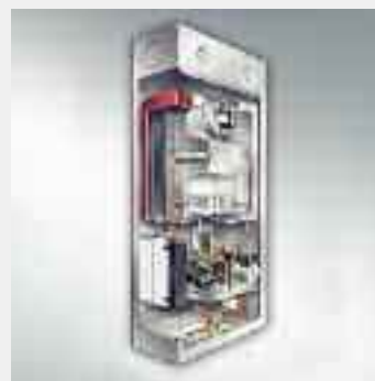
Caldaia murale a gas Vitopend 100-E, modello AH1B, per esterno e da incasso con produzione istantanea acqua calda sanitaria da 10,7 a 24,8 kW da 13,2 a 31 kW