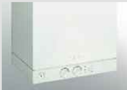
Vitopend 100-W regolazione in funzione della temperatura ambiente con sistema di diagnosi integrato

La regolazione Vitotronic è predisposta per eventuali modifiche future e Vi saprà supportare anche per interventi "importanti" quali l'integrazione del sistema di riscaldamento con un impianto solare.