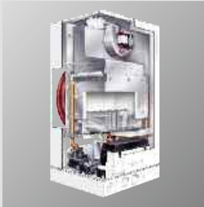
Vitopend 100-W WHKB caldaia murale a gas ad elevata resa sanitaria

Nonostante un'elevata potenzialità, Vitopend 100-W WHKB è una caldaia compatta, silenziosa, ideale per l'installazione negli ambienti domestici