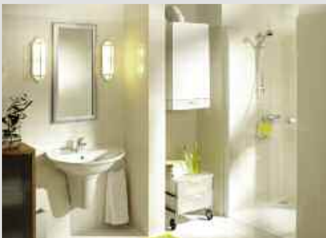
Vitopend 200-W: elevata resa d'acqua calda grazie allo scambiatore di calore a piastre con funzione Booster