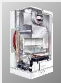
Caldaia murale a gas Vitopend 100-W, modello WHKB, con produzione istantanea acqua calda sanitaria da 10,7 a 25,5 kW da 13,2 a 31,0 kW