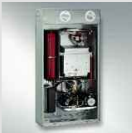
Vitopend 100-E in versione da incasso - ideale per nuovi impianti