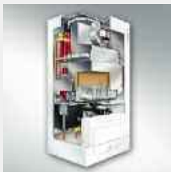
Caldaia murale a gas Vitopend 200 WHKA con produzione istantanea acqua calda sanitaria da 10,9 a 24,8 (30) kW da 10,9 a 30,3 kW