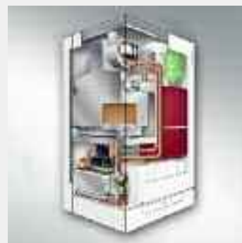
Caldaia murale a gas Vitopend 222-W WHSA con accumulo integrato in acciaio inossidabile da 10,9 a 24,5 kW