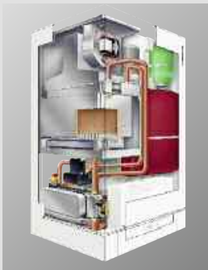
Vitopend 222-W Caldaia compatta con bollitore in acciaio inossidabile

Vitopend 222-W è economica anche nei consumi energetici, grazie al bruciatore a modulazione nella potenzialità 10,9 - 24 (30) kW e al rendimento stagionale pari al 94%. Vitopend 222-W può essere gestita con la regolazione climatica Vitotronic 200, assicurando così elevato comfort e ridotti consumi. Vitopend 222 è classificata *** secondo 92/42 CEE.