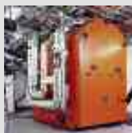
Impianto a biomassa Mawera da 110 a 13 000 kW