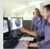
Il nuovo centro informativo dell'Accademia Viessmann