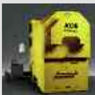
Caldaia a biomassa Köb & Schäfer da 35 a 1250 kW