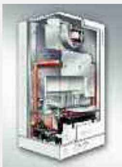
Caldaia murale a gas Vitopend 100-W, modello WH1B, solo riscaldamento o con produzione istantanea acqua calda sanitaria da 10,7 a 24,8 kW da 13,2 a 31 kW

I valori indicati fanno riferimento alle caldaie murali per funzionamento a gas metano in versione a tiraggio forzato. Per la versione a camera aperta far riferimento ai dati tecnici.