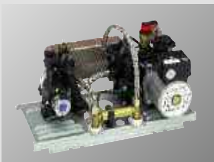
Il gruppo compatto Acqua Block facilita le operazioni di manutenzione