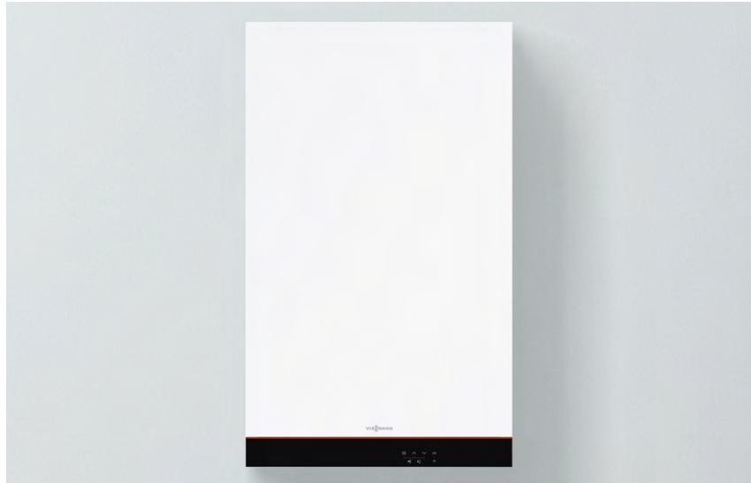
Vitodens 100-E : nuovo design e colore Vitopearlwhite

Profonda soli 249 mm, Vitodens 100-E è ideale nelle sostituzioni di vecchie caldaie installate in qualsiasi contesto abitativo.