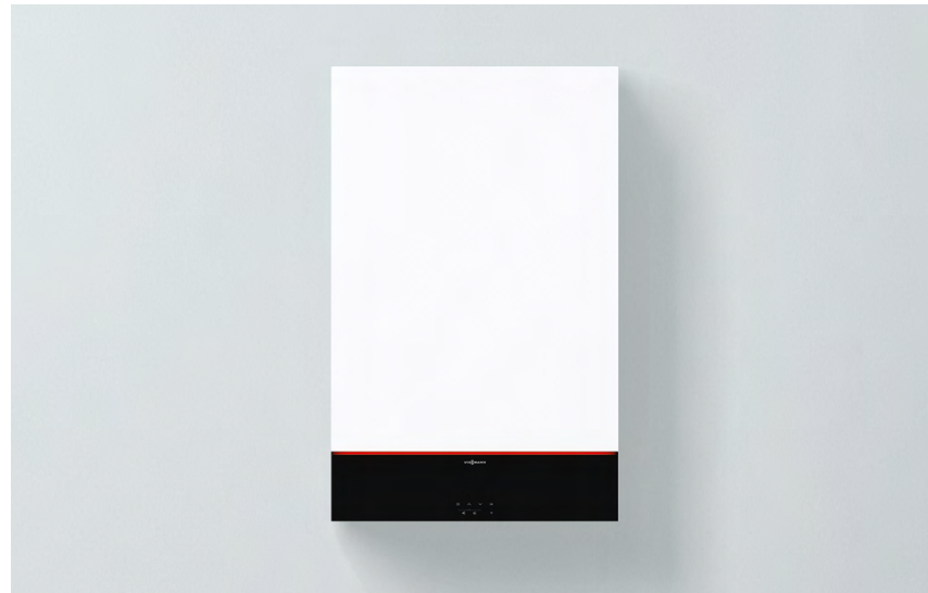
Vitodens 111-W nuovo design e colore Vitopearlwhite

Vitodens 111-W è una caldaia murale a condensazione a gas di dimensioni compatte con bollitore in acciaio inox integrato di capacità 46 litri che garantisce un elevato comfort sanitario (fino a 200 litri in 10 minuti \Delta T 30°C) con un rapporto qualità/prezzo molto interessante.