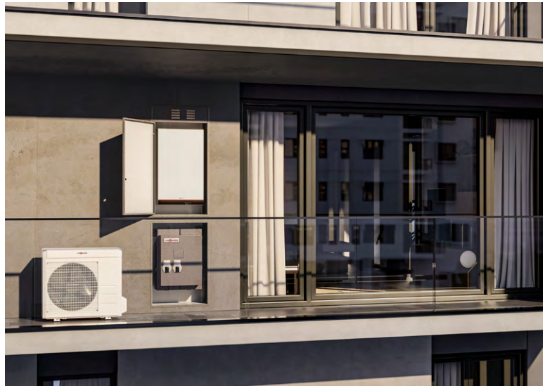
Vitodens 100-E Hybrid Plus

I sistemi ibridi Vitodens 100-E Hybrid e Hybrid Plus sono ideali nelle sostituzioni di vecchie caldaie in abitazioni o appartamenti con riscaldamento autonomo.