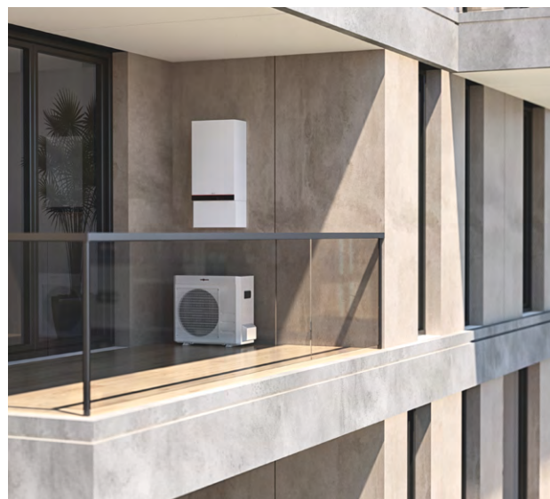
Vitodens 100-E Hybrid