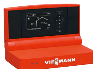
Regolazione Vitotronic 200

Tutti i generatori sono predisposti per il funzionamento a camera aperta o a camera stagna.