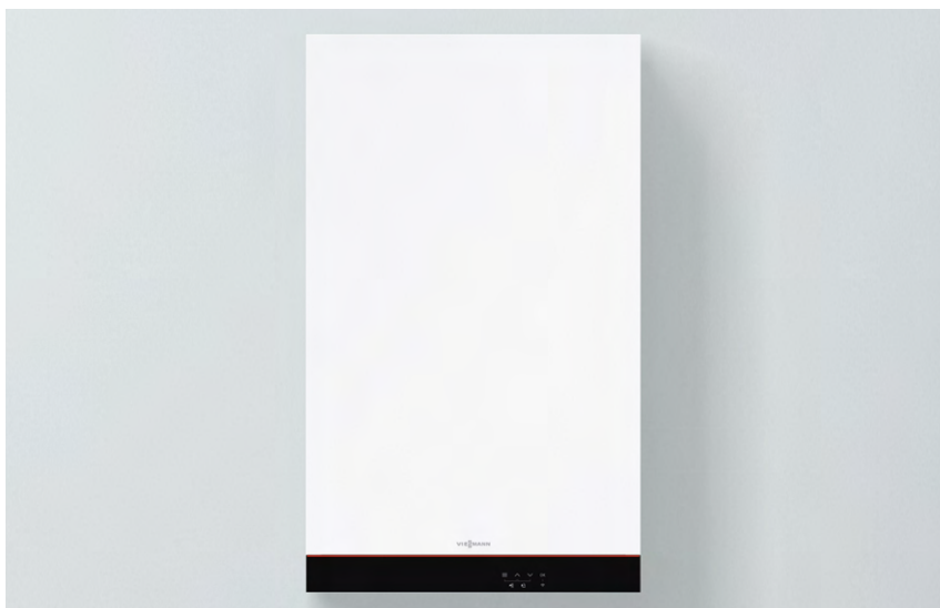
Vitodens 100-E: nuovo design e colore Vitopearlwhite

Profonda soli 249 mm, Vitodens 100-E è ideale nelle sostituzioni di vecchie caldaie installate in qualsiasi contesto abitativo.