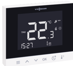
Nuovo Vitotrol 100-E