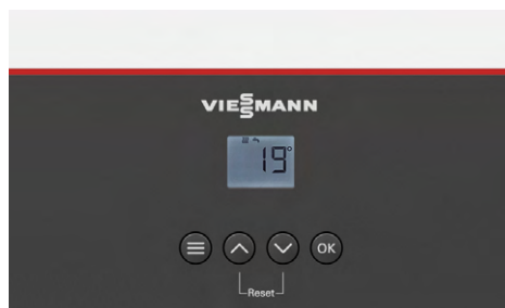
Schermo LCD con retroilluminazione bianca e 4 pulsanti

Gli stati di funzionamento e le temperature sono visualizzati sul display digitale.