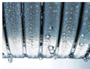
Scambiatore di calore Inox-Radial

Il corpo caldaia Inox-Radial in acciaio inox, brevettato da Viessmann, è diventato il punto di riferimento degli scambiatori in acciaio nel settore del riscaldamento. La forma è studiata per ottenere il massimo rendimento dalla condensazione in un unico passaggio dei fumi e per avere un effetto autopulente nella parte esterna dello scambiatore.