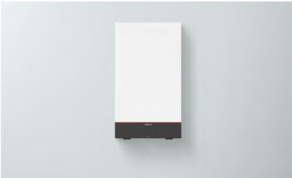
Vitodens classic: nuovo design e colore Vitopearlwhite

La qualità dei prodotti Viessmann è qualcosa su cui si può contare e la Vitodens classic, dal prezzo molto conveniente, non fa eccezione.