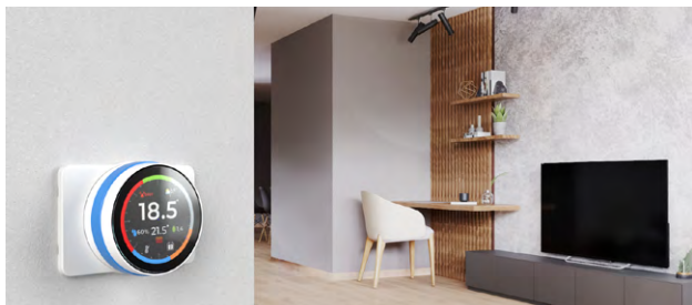
Nuovo telecomando SmartColor+