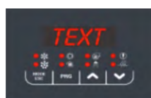
Comando a bordo macchina

Vitocal 100-A può essere gestita e monitorata dalla regolazione a bordo macchina e dai comandi ambiente Touch e Touch-Multi.