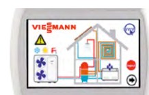
Comando Touch-Multi per il controllo in cascata fino a 7 unità