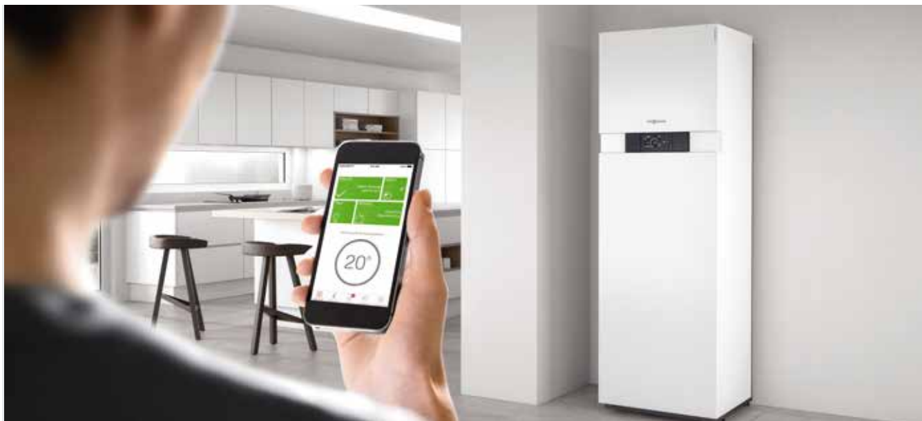
Sistema Connect - gestire la caldaia con una semplice App