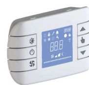
Cronotermostato LCD Modbus