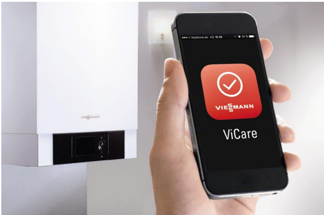
Viessmann App ViCare

Vitotrol – Questa app consente di controllare gli impianti di riscaldamento con qualsiasi generatore di calore Viessmann dotato di regolazione Vitotronic. Il funzionamento è semplice, intuitivo e facilmente utilizzabile da qualsiasi luogo e in qualsiasi momento. In aggiunta alle funzioni operative, la app Vitotrol è disponibile per dispositivi mobili con sistema operativo iOS da 5.0 o Android da 4.0