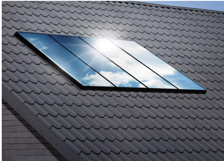
Viessmann, Vitosol 200-FM

Accanto ai pannelli solari termici piani, la gamma Viessmann offre anche pannelli solari sottovuoto come Vitosol 200-T . Questi pannelli sfruttano il principio heat pipe, basandosi sull'evaporazione e la condensazione del fluido presente nei tubi del pannello stesso. I singoli tubi possono essere ruotati in funzione dell'esposizione solare, consentendo di ottimizzare il rendimento. L'efficienza dei pannelli sottovuoto può superare del 15-20% quella dei pannelli piani; la maggiore efficienza si riscontra soprattutto nel periodo invernale in quanto il pannello, essendo sottovuoto, disperde meno e mantiene buone prestazioni anche con scarso irraggiamento solare e basse temperature esterne.