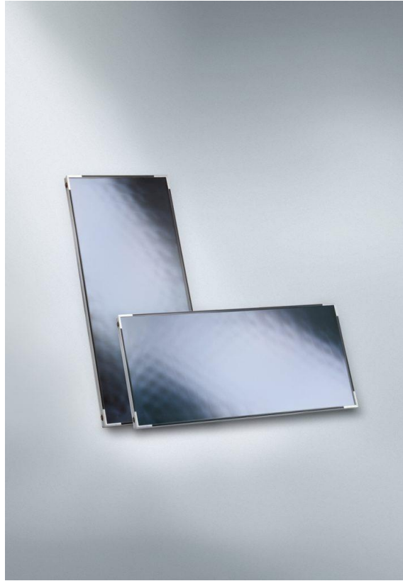
Viessmann, Vitosol 100-FM