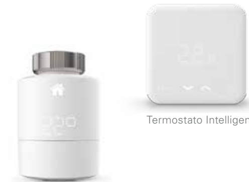
Testa termostatica Intelligente

tado° può sostituire termostati convenzionali e teste termostatiche già installate ed è compatibile con sistemi di riscaldamento sia centralizzati, sia autonomi di diverse case costruttrici. Scegli semplicemente il Kit base che ti occorre e aggiungi altri termostati intelligenti se devi controllare più stanze o zone in modo indipendente le une dalle altre.