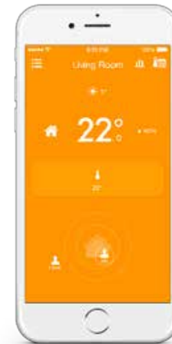
App e aggiornamenti gratuiti