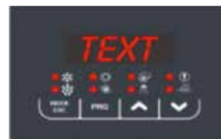
Comando a bordo macchina