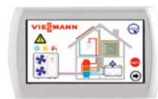
Comando touch-multi per il controllo in cascata fino a 7 unità