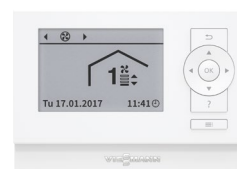
Comando LB1 per la gestione di Vitovent 300-W dai locali dell'abitazione