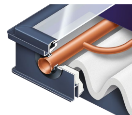
Bordo ideato per l'integrazione nel tetto (versione SV2G)

Vitosol 100-FM e 200-FM si caratterizzano per la facilità di montaggio. Il sistema di collegamento a innesto con tubo flessibile in acciaio inossidabile permette di collegare con facilità fino a 12 collettori in batteria. I pannelli Vitosol 100-FM e 200-FM possono essere montati su tetto, in facciata, in posizione libera in piano, o integrati nella copertura.