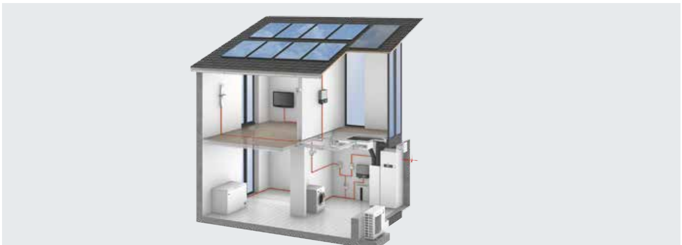
Schema di applicazione di un impianto fotovoltaico, pompa di calore e accumulo elettrico

Viessmann dà garanzie sicure, grazie anche alla sua forte presenza sul mercato ormai da 100 anni.