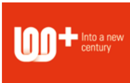
Competenza dal 1917

Viessmann, azienda leader nel settore del riscaldamento e condizionamento fondata nel 1917, offre nella sua vasta gamma di prodotti anche la serie di pannelli fotovoltaici Vitovolt. Sono disponibili sia moduli Vitovolt monocristallini che policristallini: i primi sono realizzati partendo da un singolo cristallo di silicio, il quale ne determina l'elevata efficienza. I moduli policristallini invece, sono simili per produzione ai precedenti, ma utilizzano cristalli di silicio più grezzo, e di conseguenza, di minore efficienza. Il loro vantaggio è l'ottimo rapporto qualità-prezzo.