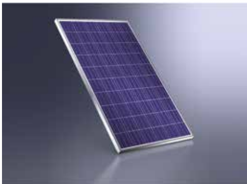
Moduli fotovoltaici policristallini ad alta resa