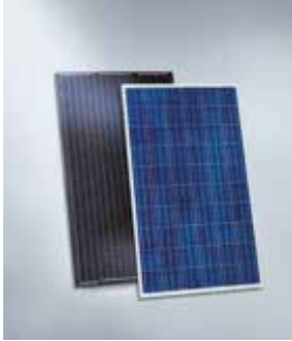
Modulo fotovoltaico monocristallino e policristallino