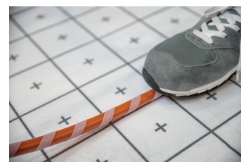
Estrema velocità di posa e massima versatilità